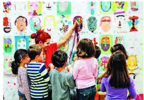
Διαδραστικά εκθέματα για τις βασικές αρχές των θετικών επιστημών προσφέρει το κέντρο τεχνολογίας «Αθήνα» στο Ιδρυμα Ευγενίδου (αριστερά), εκμάθηση σχεδίου με μοντέλα αρχαιοελληνικά αριστουργήματα το Εθνικό Αρχαιολογικό Μουσείο (μέση) και ζωγραφική και κατασκευή μάσκας το εκπαιδευτικό πρόγραμμα του Μουσείου Κυκλαδικής Τέχνης (δεξιά).