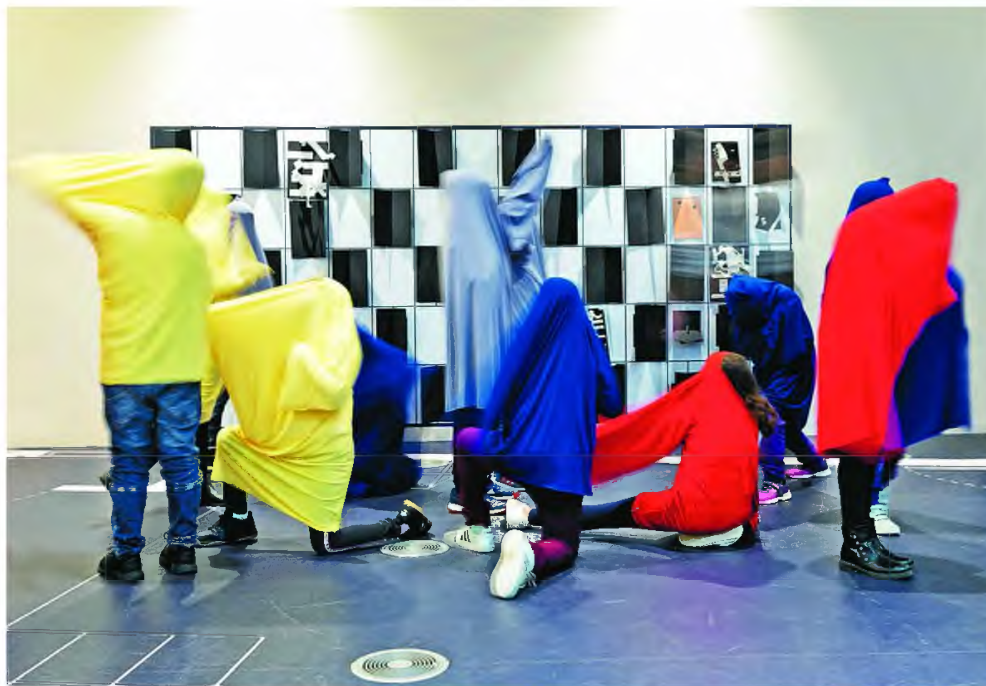
Τα παιδιά ξεναγούνται στην έκθεση «Γιώργος Ζογγολόπουλος: Το όραμα μιας δημόσιας γλυπτικής», και στήνουν τα δικά τους ζωντανά γλυπτά.

Τα εκπαιδευτικά προγράμματα γνωρίζουν μεγάλη ανάπτυξη τα τελευταία χρόνια και πλέον είναι κάτι αυτονόητο για τους πολιτιστικούς φορείς και οργανισμούς, οι οποίοι συναγωνίζονται στην ευρηματικό-